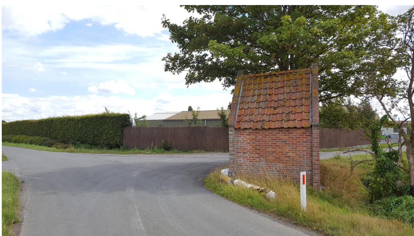
Waar we nu de heidematten afsluiting zien stond vroeger De Vijfwegen . Op de voorgrond het Brigandskapelletje.

Deze herberg had zijn naam niet gestolen. Hij stond op de kruising van vijf wegen, van hier uit kon je vijf kanten uit. Nu zie je nog slechts vier wegen op het kaartje hierboven. De verdwenen vijfde weg was een deel van de kerkweg die langs de zijgevel van De Vijfwegen naar 't Stroomke liep. Samen met dit wegelinkske is ook de herberg verdwenen, afgebroken en opgegaan in de erven van de plantenkwekerij Horizon.