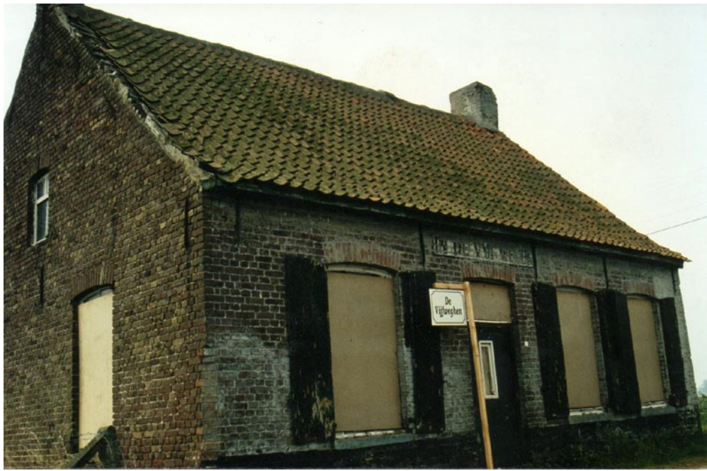
De Vijfwegen vlak vóór de afbraak